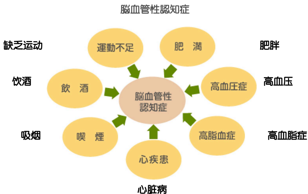
[図：脑血管性認知症の危険因子]

脑血管性认知症，是由脑血管障碍引起的。而诱发脑血管障碍的疾病有：脑梗阻、脑血栓、脑塞栓、脑溢血、蛛网膜下出血等。致使这些疾病发生的危险因子是缺乏运动、肥胖、盐分摄取过多、饮酒、吸烟等不良生活习惯，还有高血压、高血脂症、糖尿病及心脏病等疾患。