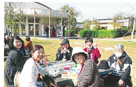
ここで昼食を食べました。／ 在此吃了午餐。