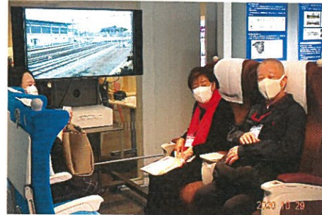
旅行気分が味わえます。／ 品味了旅行的气氛。