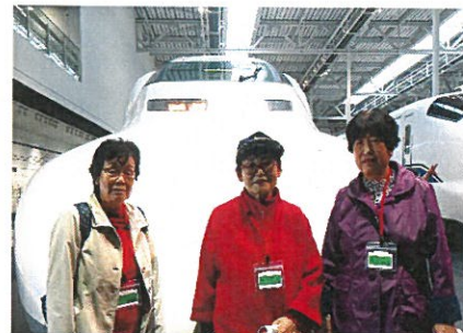
新幹線の前で記念写真／ 在新干线前的纪念照