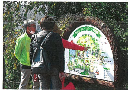
南門から入場しました。／ 从南门入场。