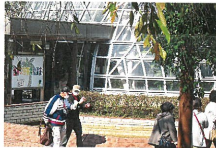
世界の熱帯果樹温室前です。／ 世界的热带果树温室前。