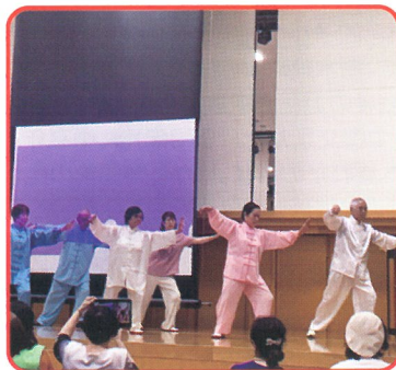
首都圏センター学習発表会