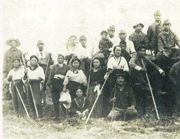
DVD『満蒙開拓の真実』より