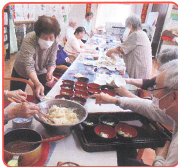
デイサービスの帰国者(高知市「やまもも」)