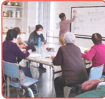
地域の日本語教室で学ぶ帰国者たち