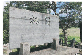
千振開拓の碑 (栃木県那須町)

現在の中国東北部(旧満洲)には終戦まで多くの日本人が住んでいました。宇都宮餃子が中国東北部由来であることが知られているように、栃木県に引き揚げてきた人も少なくありません。一方、戦後の混乱で家族と生き別れ、残留した子供や女性達は日中国交正常化(1972年)後、中高年となってようやく祖国へ戻れたのです。しかし帰国後の生活は、言葉の壁や文化の違いに苦しむ日々でもありました。県内にも多くの帰国者と家族の方々が暮らしています。戦後80年を迎えつつある今、負の歴史を繰り返さないためにも、かれらの物語に耳を傾けてみませんか？