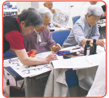
首都圏センター書道講座