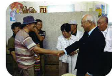
去年广岛定着促进中心交流会的情形

中心计划举办优先照顾福冈定着促进中心结业者为主的交流会。您不希望借此机会和以前的老师重温旧情吗?希望参加者请直接与中心联系。详细日程确定后,向报名者发送具体资料。 日期:预定为平成24年11月(2天1宿) 参加费:1人10,000日元左右(预定) ※包括旅馆的住宿费以及伙食费