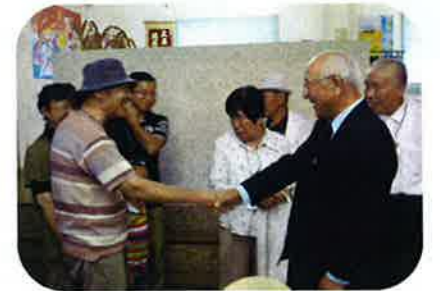
昨年度の広島定着C交流会の様子