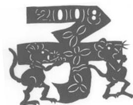
京都府 伊藤桂子さんの切り絵 京都府 伊藤桂子女士の剪纸